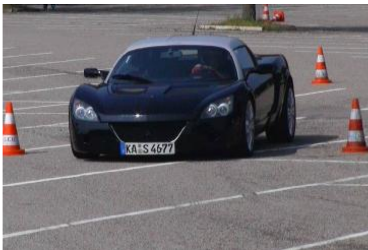
3. Sieger 2005 Rüdiger Schwab