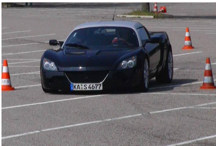
3. Sieger 2005 Rüdiger Schwab