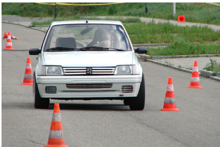
1. Sieger 2006 Bernd Wurster