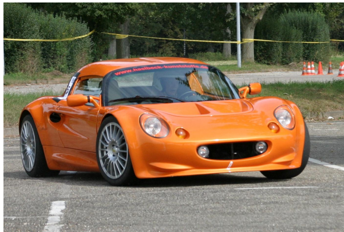
2. Sieger 2008 Thomas Haslbeck