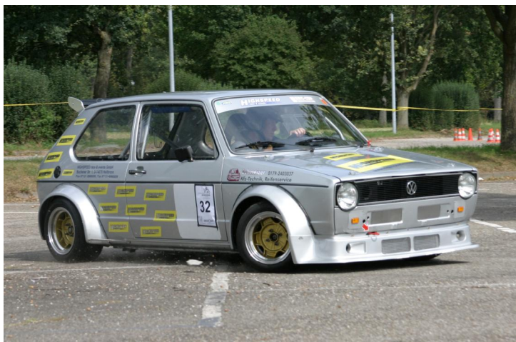
1. Sieger 2008 Oliver Schweizer