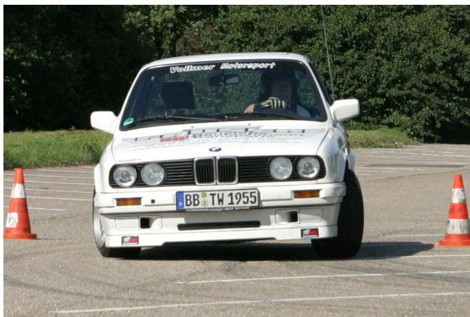
3. Sieger 2008 Wolfgang Olaynig