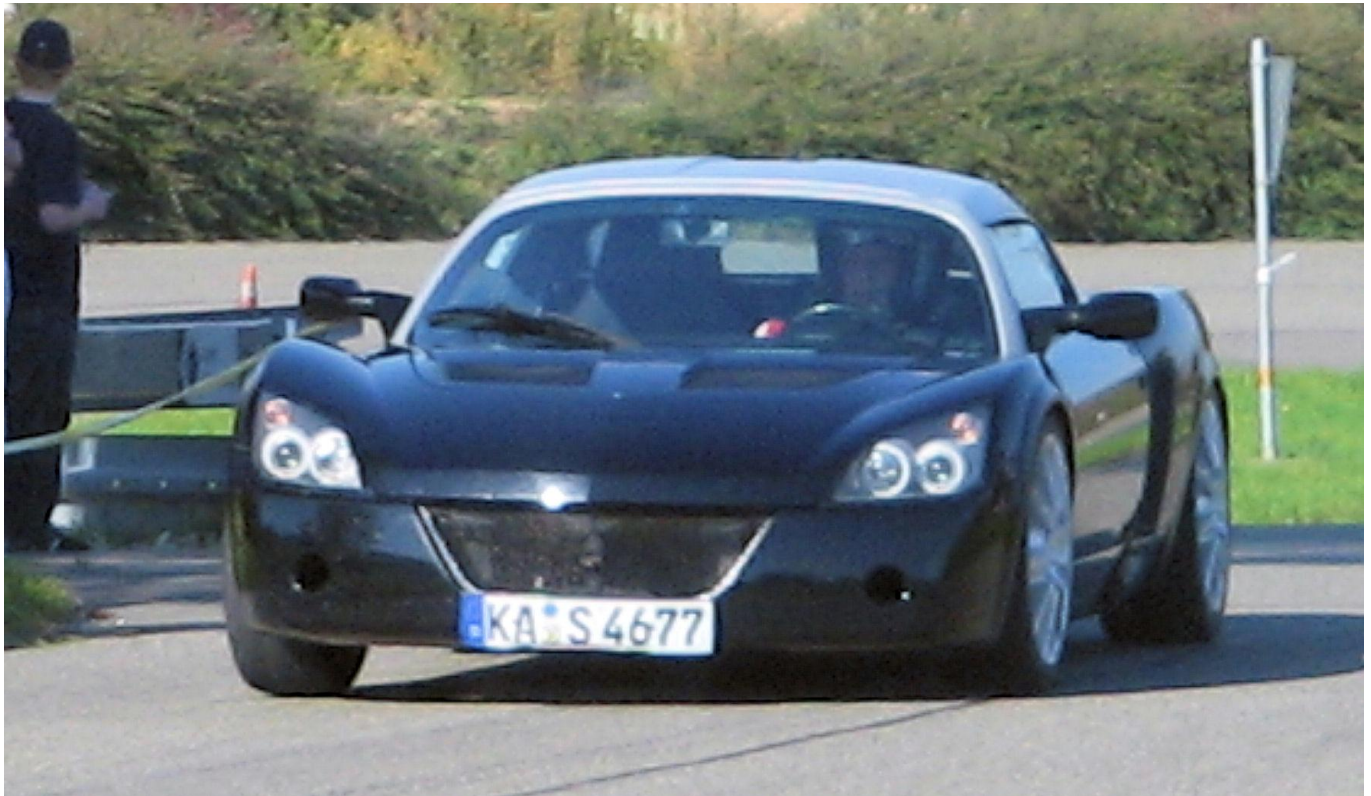
Sieger 2007: Rüdiger Schwab

Die besten 50% der Fahrer (Stand 08.09.2008) in den einzelnen Klassen des Gerhard Mitter Solitude Cups werden zum ADAC-Slalom-Saison-Finale auf der Verkehrsübungsanlage Stuttgart-Solitude eingeladen.