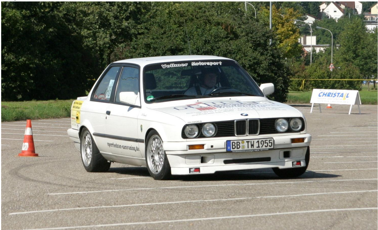
Sieger 2008: Wolfgang Olaynig

Die besten 50% der Fahrer (Stand 07.09.2009) in den einzelnen Klassen des Gerhard Mitter Solitude Cups werden zum ADAC-Einladungs-Slalom auf der Verkehrsübungsanlage Stuttgart-Solitude eingeladen.