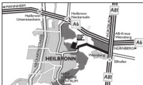
A 01 BAB Abfahrt 10, Weinsberg-Eltufen, Richtung Heilbronn, nach Tunnel ca. 600 m rechts abbiegen zur Verkehrsübungsanlage Heilbronn.

INGENIEURBÜRO STEPHAN SACHVERSTÄNDIGE FÜR DAS KFZ-RESEN