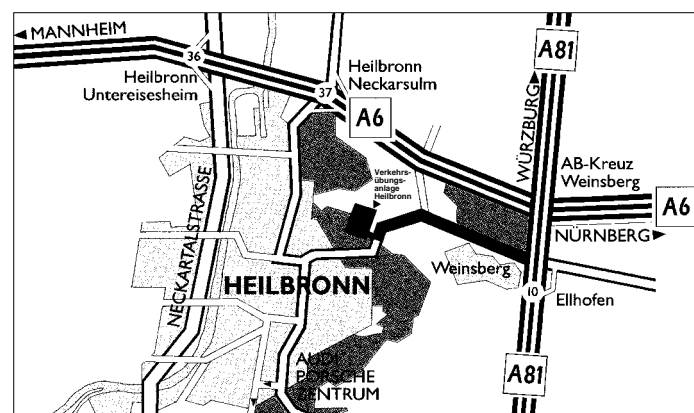
A 81 BAB Abfahrt 10, Weinsberg-Ellhofen, Richtung Heilbronn. Nach Tunnel ca. 600 m rechts abbiegen zur Verkehrsübungsanlage Heilbronn.

(Registrierungs-Nr. liegt dem Veranstalter mit der Original-Ausschreibung vor)