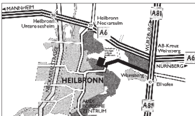
A 81 BAB Abfahrt 10, Weinsberg-Ellhofen, Richtung Heilbronn. Nach Tunnel ca. 600 m rechts abbiegen zur Verkehrsübungsanlage Heilbronn.

INGENIEURBÜRO STEPHAN SACHVERSTÄNDIGE FÜR DAS KFZ-WESEN